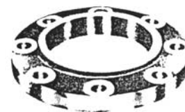
SUS 304 法蘭