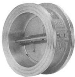
不銹鋼 雙瓣式逆止閥