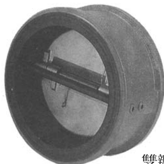
標準型 雙瓣式逆止閥